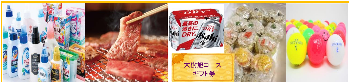
大樹旭コース ギフト券